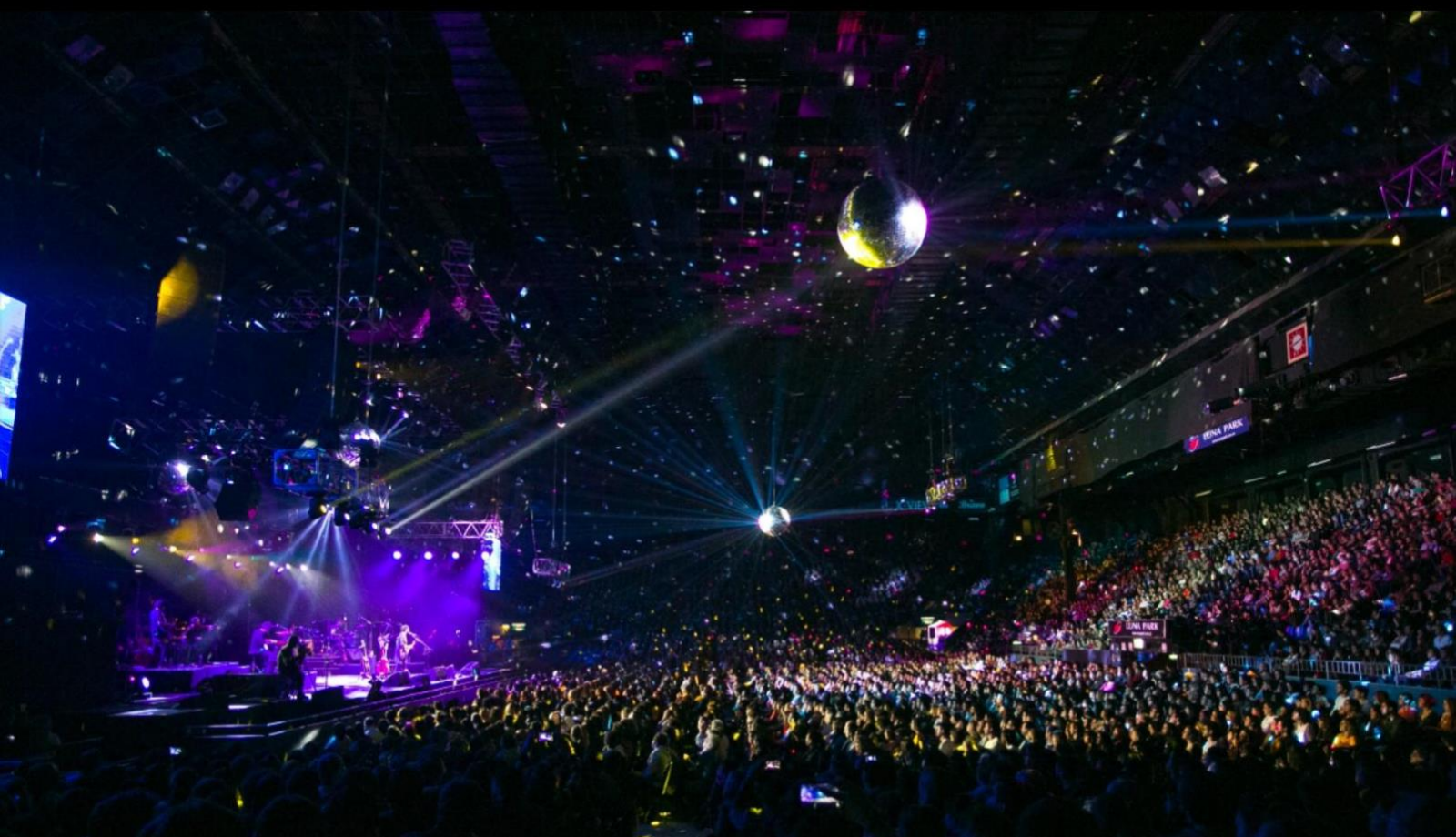
Show en Luna Park 2018

" Desde su debut en 2004, pasó de ser un desconocido cantor r ionegrino, a faro de una nueva generación de cantautores, productor prestigioso y compositor consagrado."